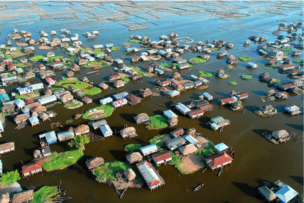
5) Beninän binon davedöp jivifagolana jiel ‚Odile Ahouanwanou‘.